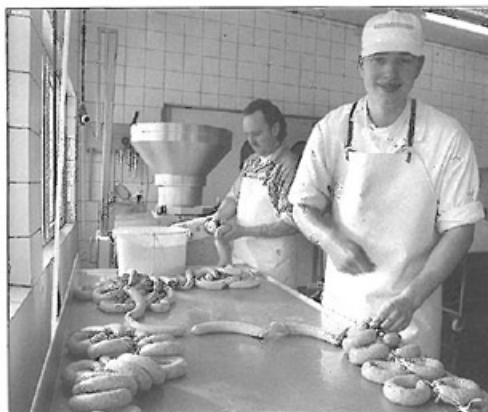
Produktion: Zwischendurch 40 Kilogramm Brägenwurst.