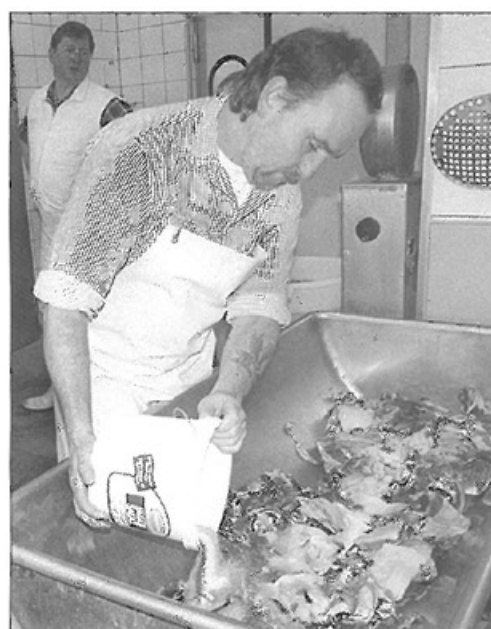
Würzen: Die richtige Mischung bringt den guten Geschmack.

ke, der seinem Vater nachefert und ebenso mit Leib und Seele das Fleischerhandwerk ausübt.