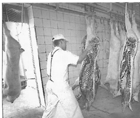
Kurzer Transportweg: Vom Schlachthaus in den Kühlraum.